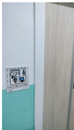
Cartel interior PVC

Gracias a un premio que recibimos en la Convocatoria Educaixa 2025, este año hemos podido mejorar la calidad de la cartelería de todo el centro destinando parte de la dotación económica a señalar con carteles de PVC todos los espacios interiores y con Dibond, los exteriores.