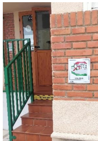
Cartel exterior dibond